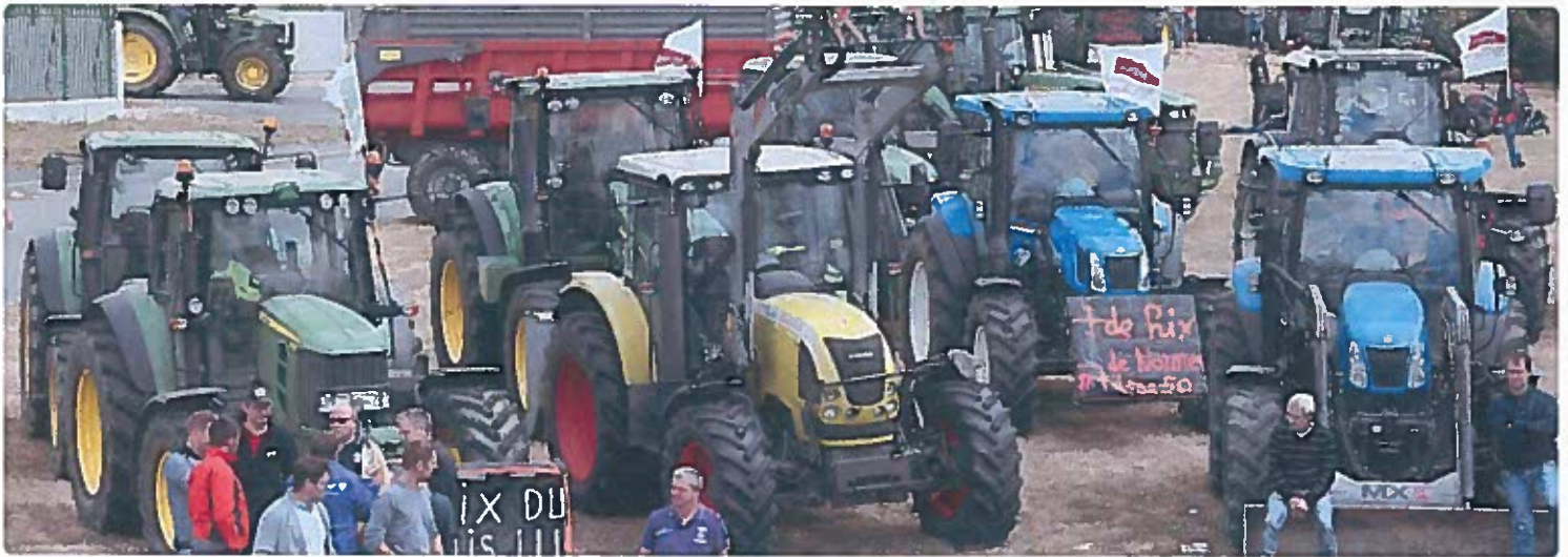
Die französischen Bauern forderten kürzlich in einer Demo faire Preise für ihre Produkte.